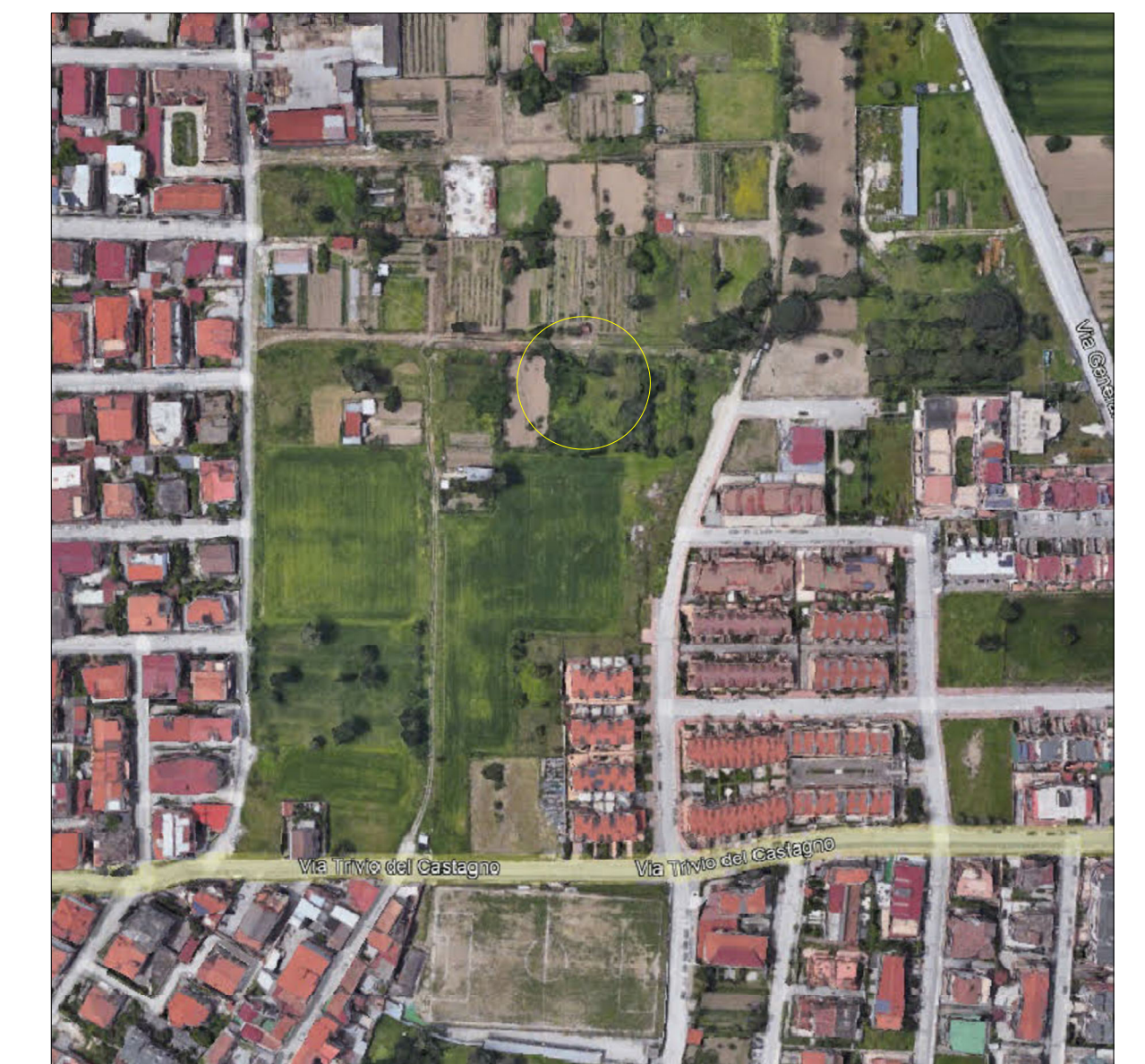
STRALCIO AEREOFOTOGRAMMETRIA 1 : 4000